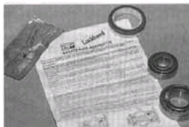
Vorbildlich: Der neue Lagersatz von Lockheed enthält eine gute Montageanleitung und sogar Fett

ches Walzlagerfett. Auf der Innenseite der Radnabe muss nun das große Kegelrollenlager in seinen Lauftring gelegt werden, dann folgt die Montage des Filzrings. Auch hier hilft eine Stahlplatte beim Einschlagen des Blechkäfigs.